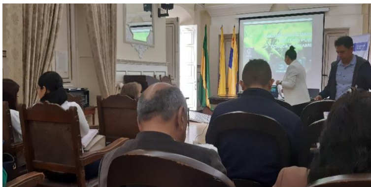
Socialización de los resultados del primer taller.