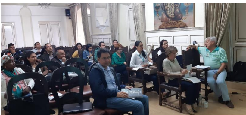
Priorización de problemas.