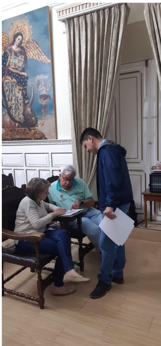
Apoyo en la valoración de incidencia de los problemas.