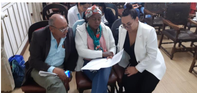
Valoración de incidencia de los problemas priorizados.