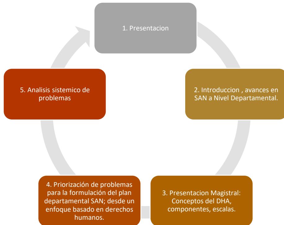
Figura 1. Ruta metodológica para la realización del taller 2 de gestión territorial de la SAN – DHAA.

La duración del desarrollo del taller fue alrededor de 7 horas. Las actividades de este taller se desarrollaron a partir de la siguiente ruta metodológica.