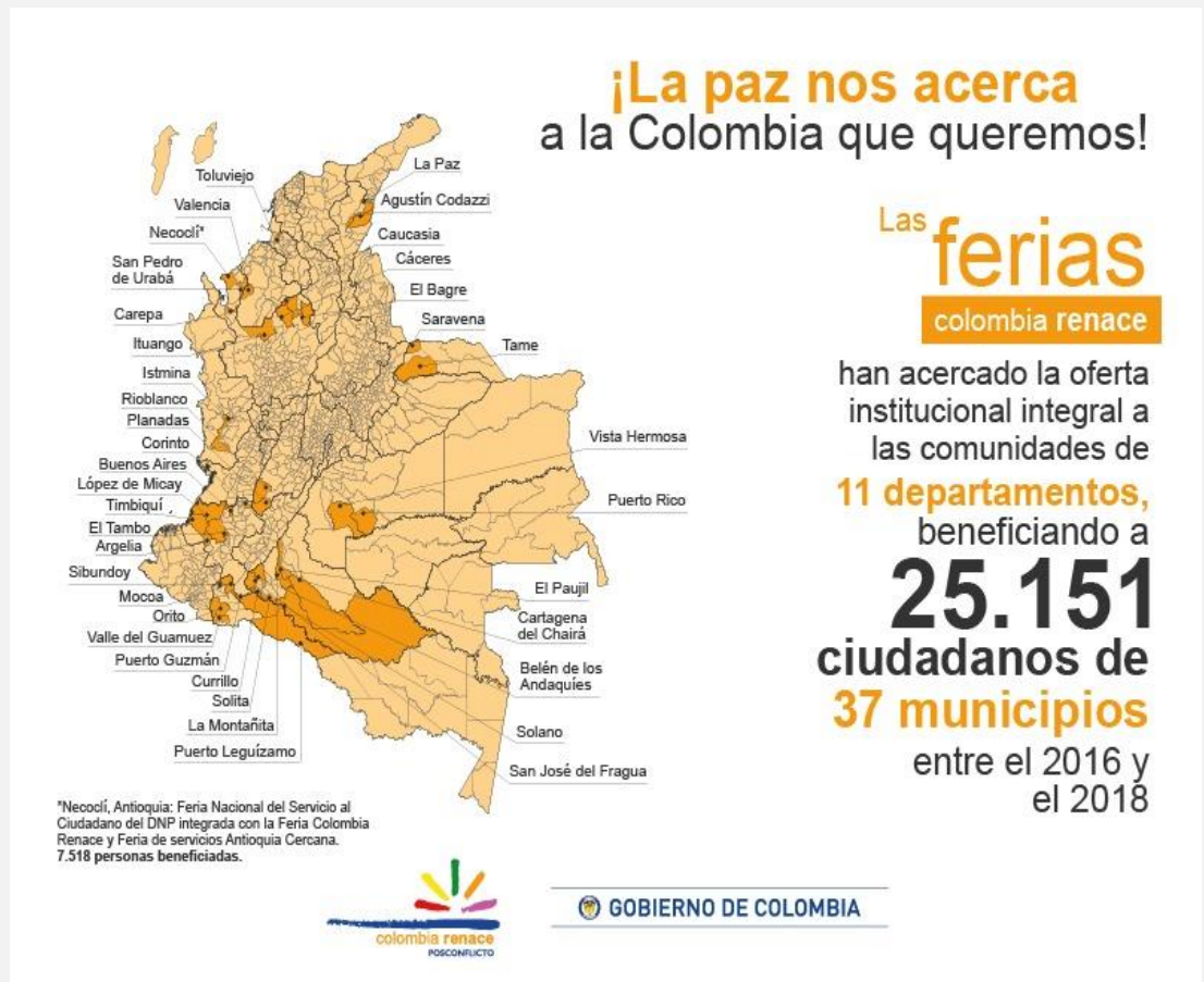
Gráfico No. 1 información de todas las Ferias Colombia Renace