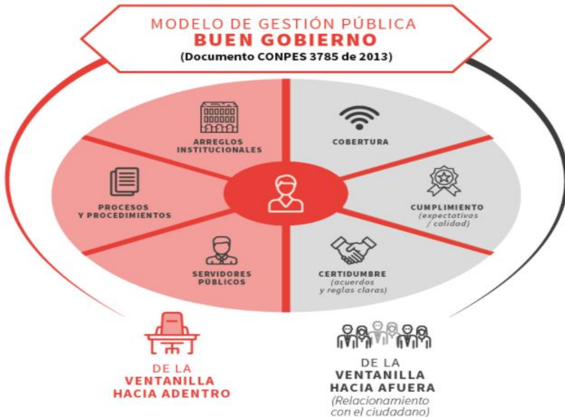
Ilustración 3. Modelo de Gestión Pública Buen Gobierno