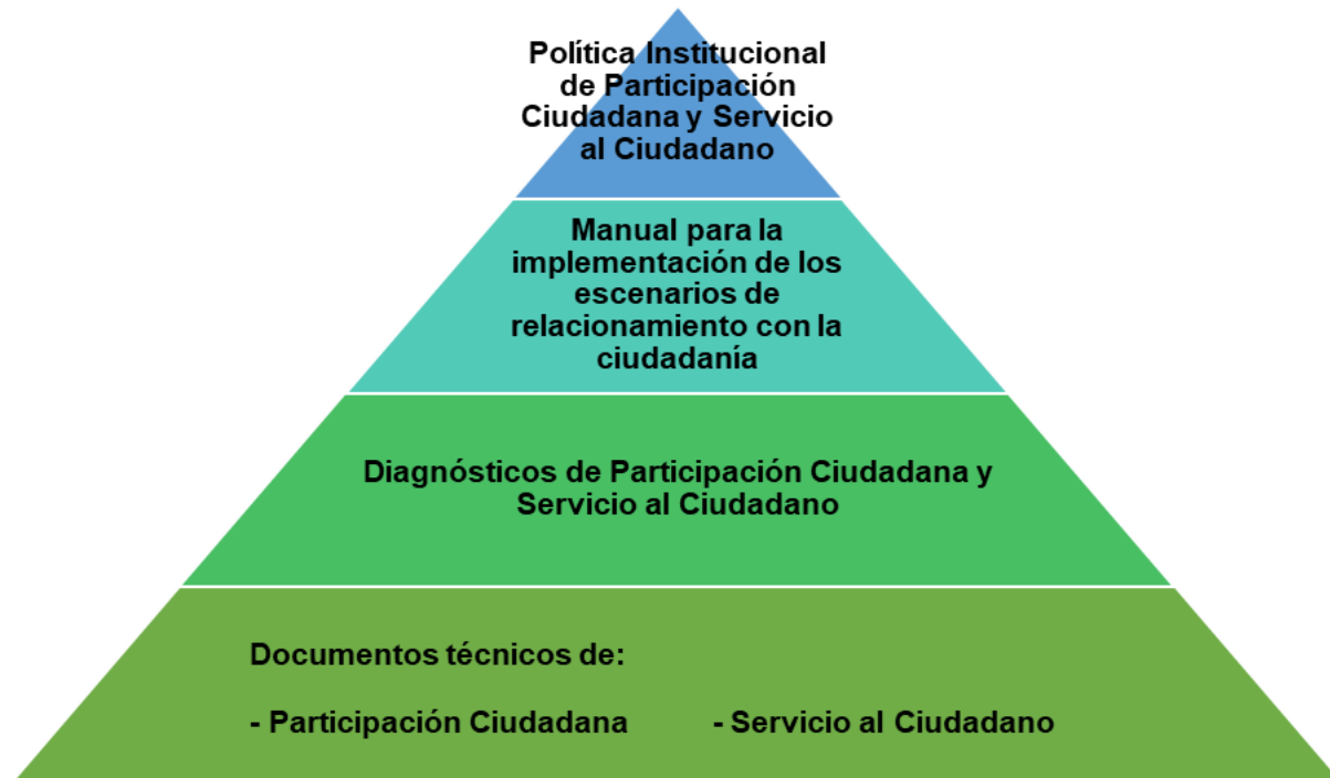
Ilustración 1. Estructura documental de la Política Institucional de Participación Ciudadana y Servicio al Ciudadano